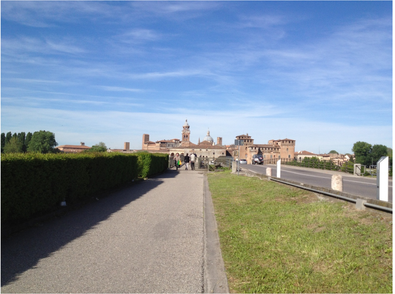
Giovedì 26/04/12 Mantova vista dalla pista ciclabile in zona Area di sosta camper.