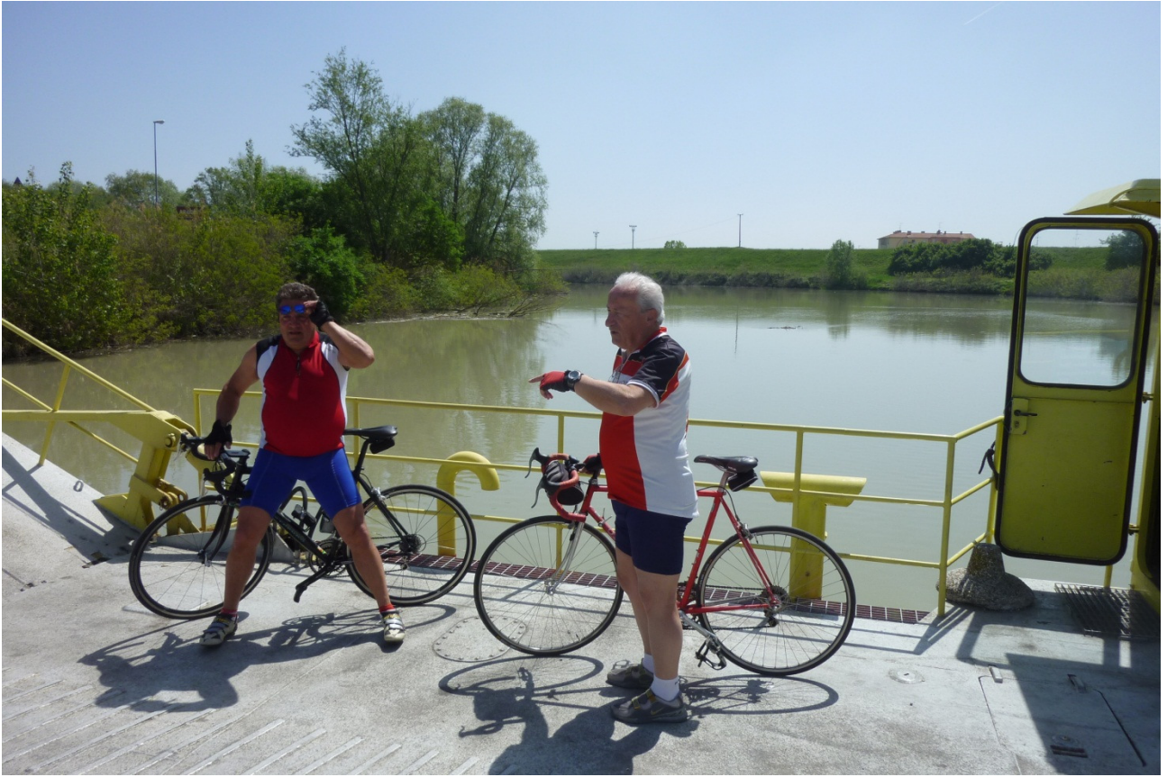
Venerdì 27/04/12 Giro delle Valli. Sant'Alberto ..... Su un barcone che ci traghetta.