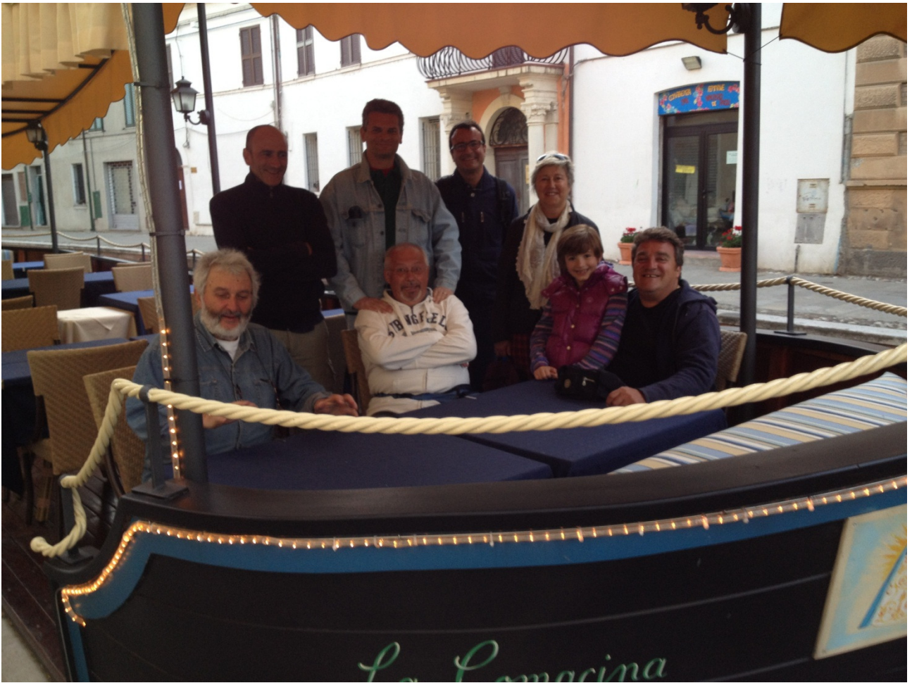
Giovedì 26/04/12 Comacchio ..... sul canale di fronte al ristorante "La Comacina" in trepidante attesa della cena.