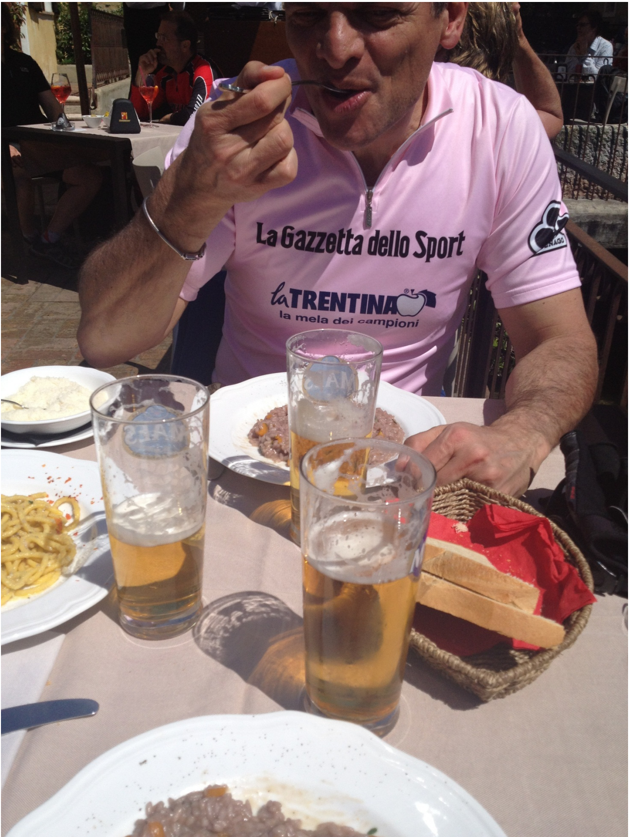
Giovedì 26/04/12 ..... Appunto che vale anche per Geppo ..... ed anche per me, naturalmente.