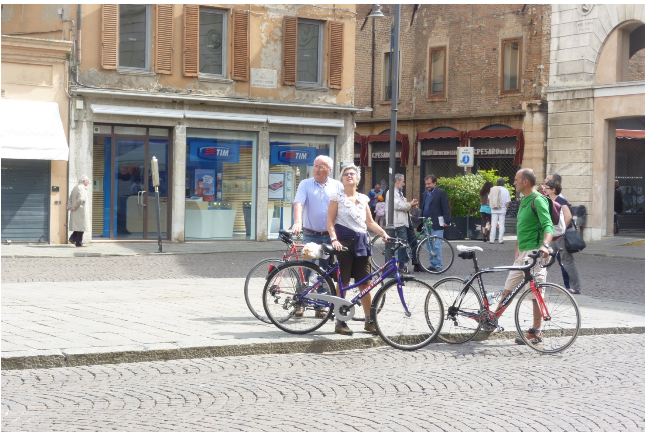
Domenica 29/04/12 A zozzo per le vie di Ferrara.