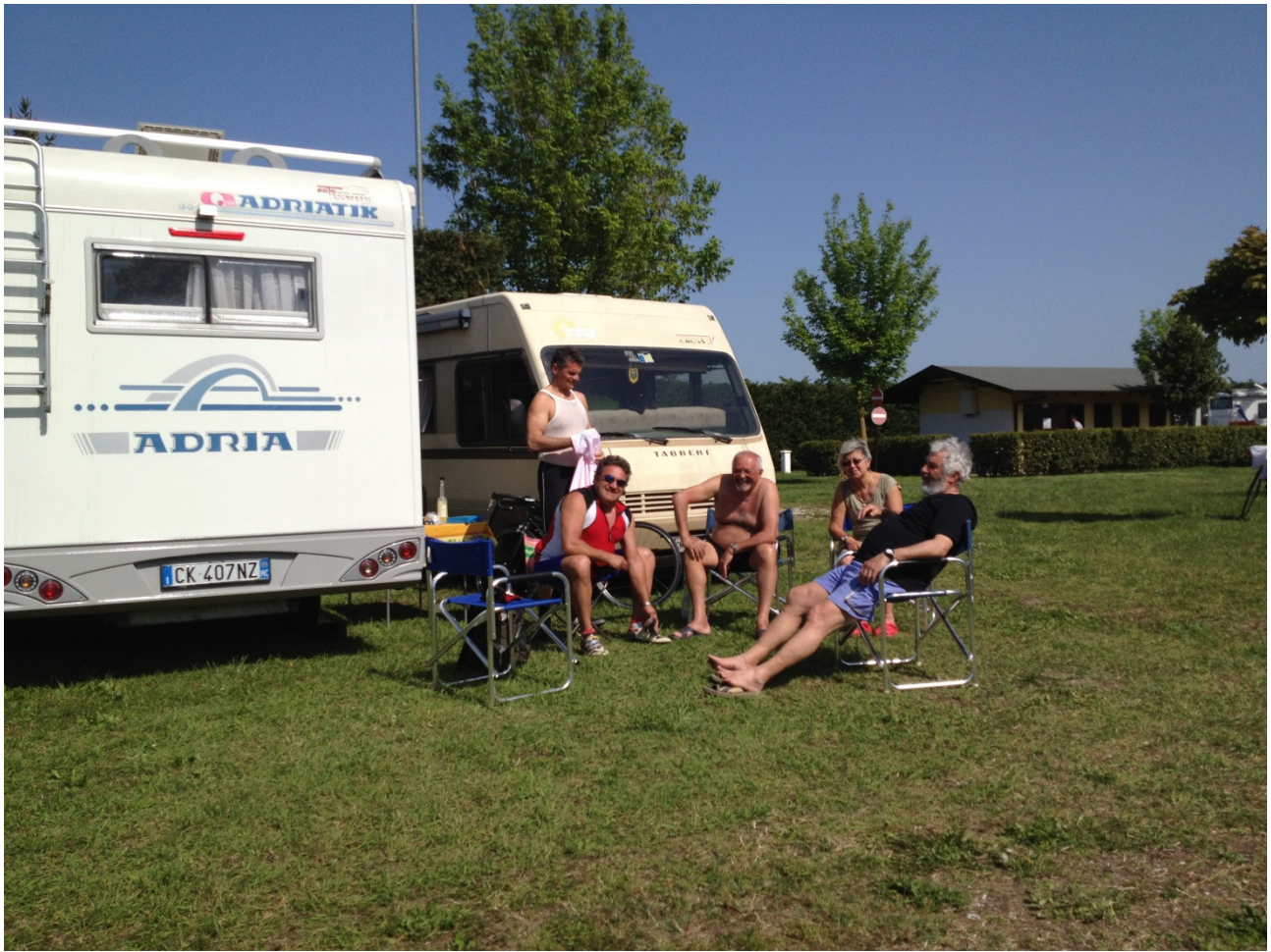
Venerdì 27/04/12 Area sosta di Comacchio. Relax dopo la pedalata intorno alle Valli. In attesa di partire per Bosco Mesola.