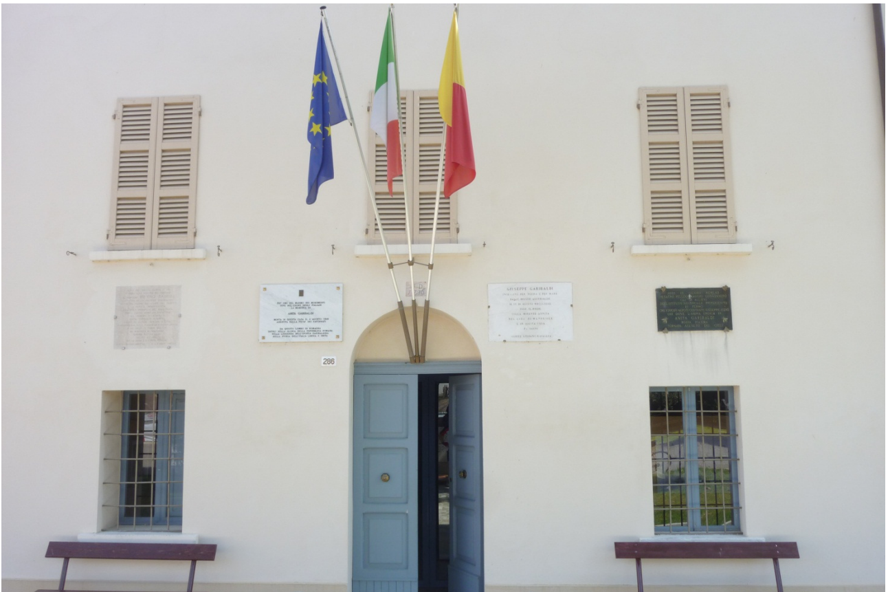
Venerdì 26/04/12 Giro delle Valli. Mandriole Casa dove morì Anita Garibaldi