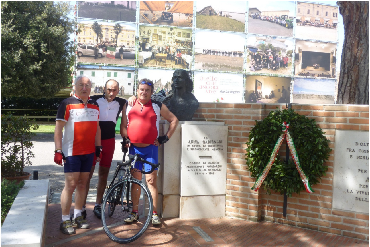
Venerdì 27/04/12 Giro delle Valli. Mandriole Foto ricordo davanti alla casa dove morì Anita Garibaldi.