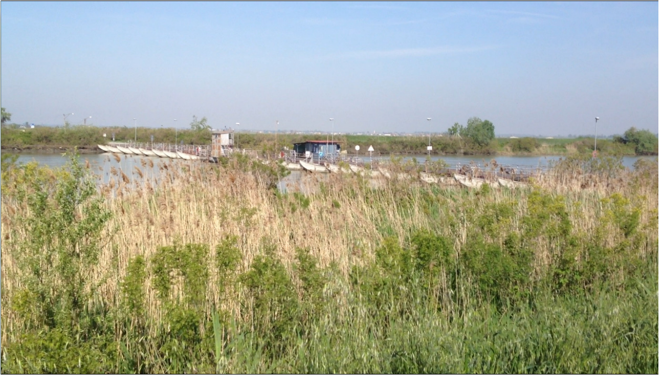
Sabato 28/04/12 Parco Delta del Po abbiamo appena attraversato uno dei tanti ponti di barche.