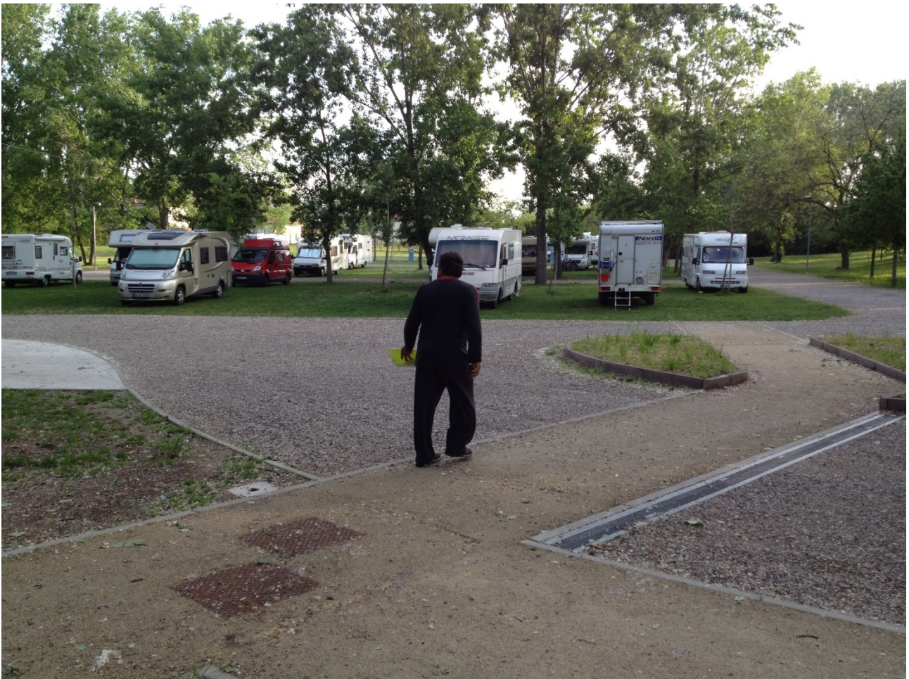
Giovedì 26/04/12 L’area di sosta comunale di Mantova.

Clamorosa cena conviviale ..... e tutti a nanna.