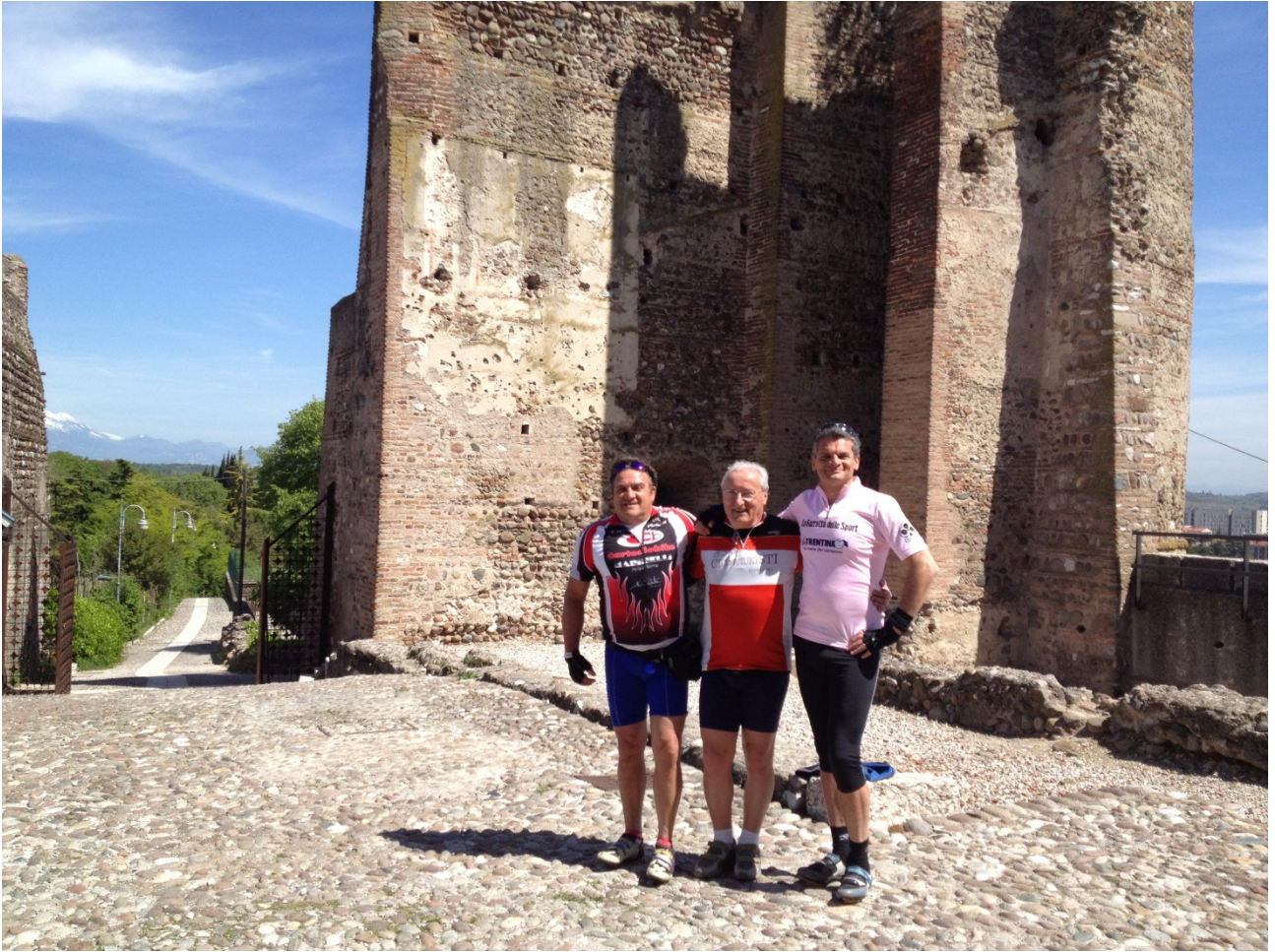
Giovedì 26/04/12 Foto ricordo al Castello di Valeggio sul Mincio.