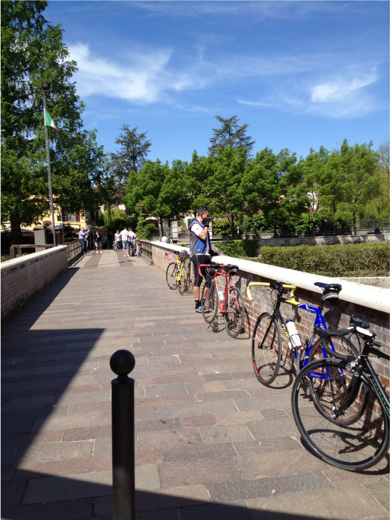
Giovedì 26/04/12 Borghetto sul Mincio (frazione di Valeggio sul Mincio)