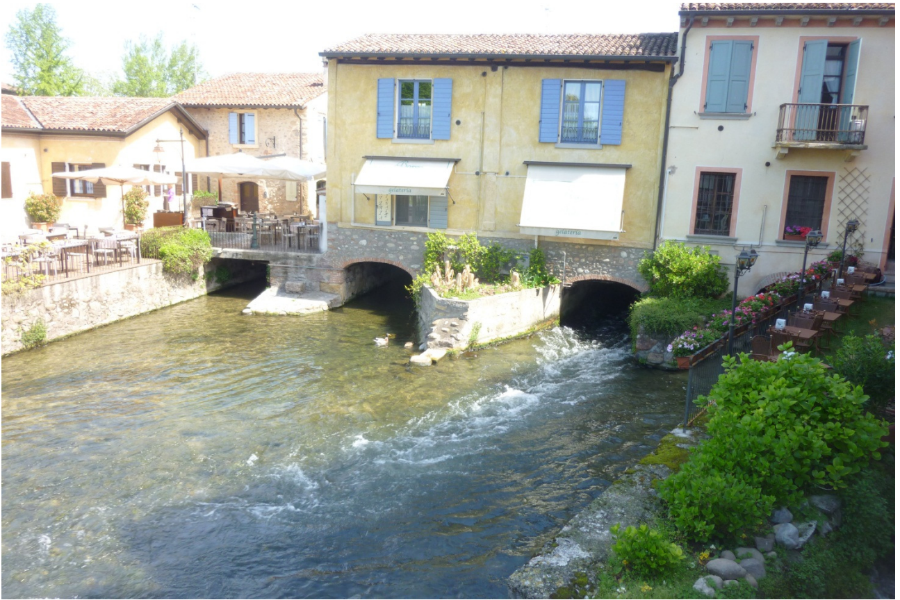
Giovedì 26/04/12 Borghetto sul Mincio. Sull'estrema sinistra della foto i tavolini del ristorante dove pranzeremo.