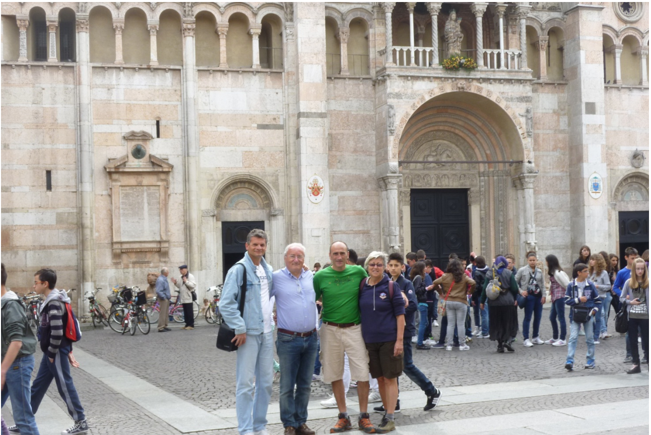
Domenica 29/04/12. Foto ricordo davanti al Duomo di Ferrara.