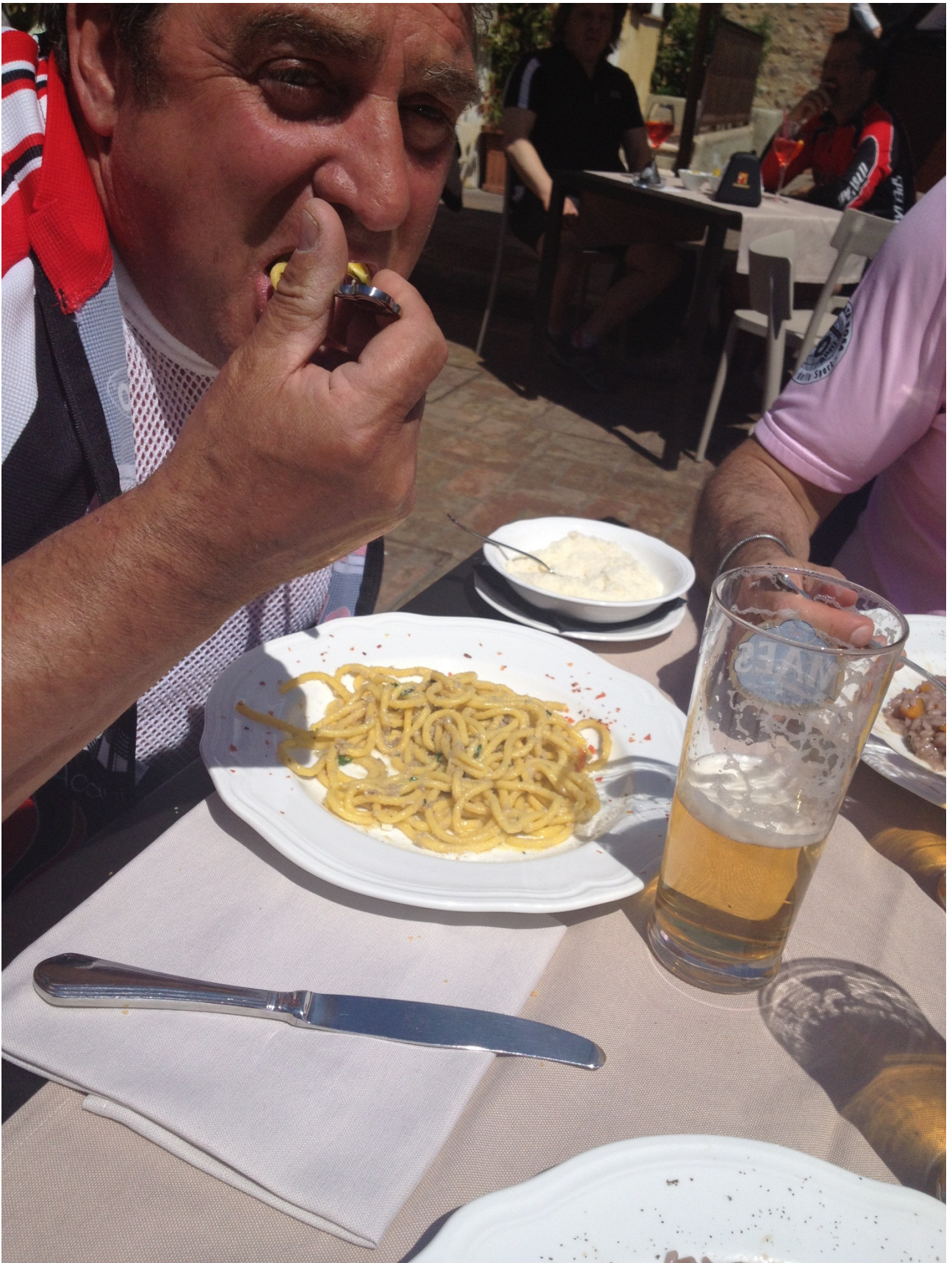
Giovedì 26/04/12 ..... appunto.