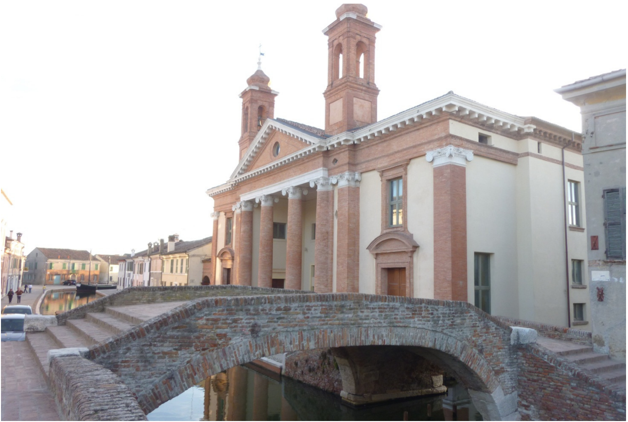
Giovedì 26/04/12 Per le vie ed i canali della bella Comacchio.